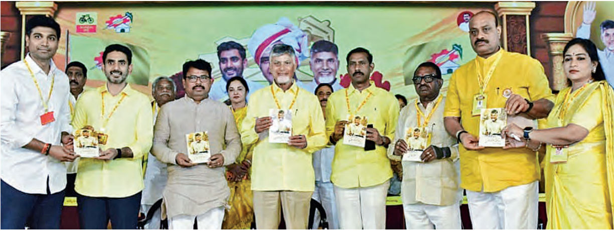
గురువారం మహానాడు సభలో 'కాలపురుషుడి సంతకం' పుస్తకాన్ని అవిష్కరిస్తున్న సిఎం చంద్రబాబు. చిత్రంలో మంత్రులు లోకేశ్, అచ్చెన్నాయుడు, అనిత తదితరులు

విజయవాడ, మే 28 ప్రభాతవార్తా ప్రతినిధి: మొదటి కలి పెట్టి నా జై చంద్రబాబు, జై తెలుగుదేశం అంటూ ప్రాణం వదిలిన కార్యకర్తల శిరోధార్యం అని టిడిపి జాతీయ అధ్యక్షుడు నారా చంద్రబాబు నాయుడు స్పష్టం చేశారు. 2047 నాటికి స్వర్ణాంధ్రను విశ్వవిఖ్యాతం చేస్తామన్నారని, మహానాడు రెండో రోజున కీలకమైన రాజకీయ తీర్మానం కేంద్ర మంత్రి కె.రామోహన్ నాయుడు పెట్టారు. గొడ్డలి పార్టీ పాలనలో రాష్ట్రం ఆర్థిక సంక్షోభం, పెట్టుబడుల తగ్గడం, పరిశ్రమల వలస, సాగునీటి ప్రాజెక్టుల నిరక్షయం, యువతలో నిరుద్యోగం వంటి అనేక సవాళ్లను ఎదుర్కొన్నాం. ఈ నేపథ్యంలో రాష్ట్రాన్ని మళ్లీ అభివృద్ధి మార్గంలో నడిపించాల్సిన చారిత్రాత్మక బాధ్యతను ప్రజలు కూటమి ప్రభుత్వంపై పెట్టారు. ప్రజల ఆశయాలను కేంద్ర బిందువుగా తీసుకుని అభివృద్ధి సంక్షేమ సమాన