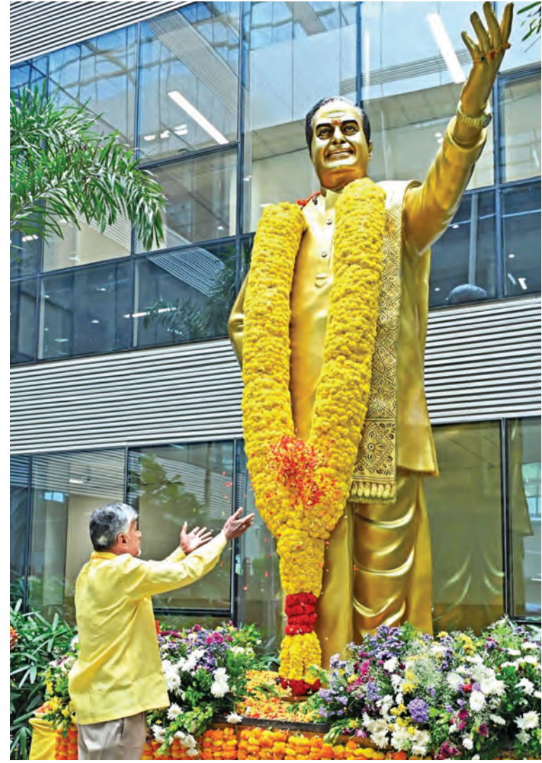
గురువారం ఎన్టీఆర్ జయంతి, మహానాడు సందర్భంగా పార్టీ కేంద్ర కార్యాలయంలో ఆయన విగ్రహానికి పూలమాల వేసి నివాళులు అర్పిస్తున్న సిఎం చంద్రబాబు నాయుడు